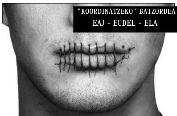
"KOORDINATZEKO" BATZORDEA EAJ - EUDEL - ELA

Ez dugu langileen kolektiboari muzin egin diezaioten utziko, eta ordezkaturako sindikatu guztiok egongo garen beste negoiazio markoaren alde ireki dezan dei egingo diogu EUDELi; bertan kolektiboarentzat oso garrantzitsuak diren gaiak planteatu nahi ditugu: sailkapen taldea, bigarren jarduera, txandak, formakuntza, alde zaurerako jubilazioa. LABek 2008ko hitzarmenerako negoiazioen harira ekarriko ditu gaiok aztergai eta negoziagai.