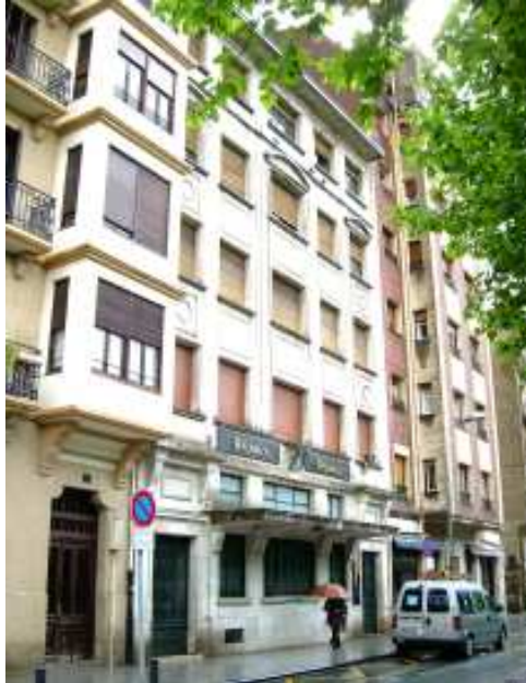
Edificio en el centro de Irun propiedad de Correos inutilizado durante años.

ANTIGUO-DONOSTIA: lokala erosita eta obra egiteko zai.